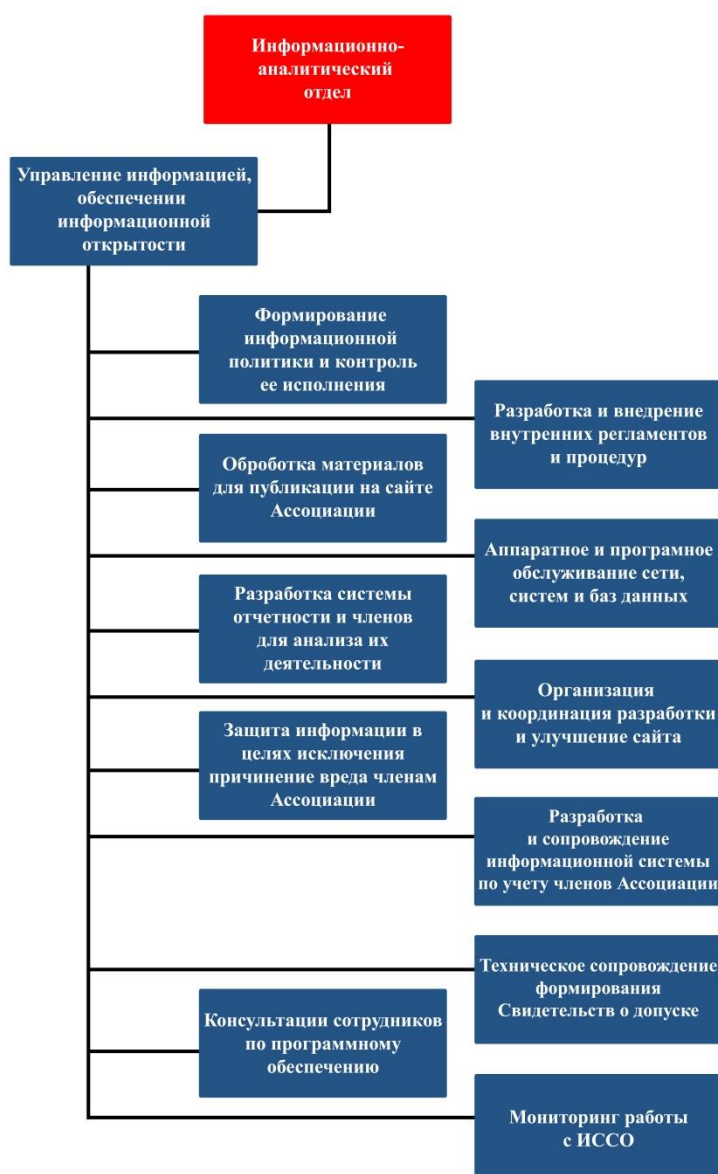
(Рис.1) Процесс основной деятельности ИАО